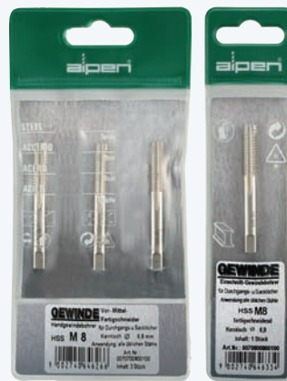
Plastiktasche | Plastic wallet Confezione busta