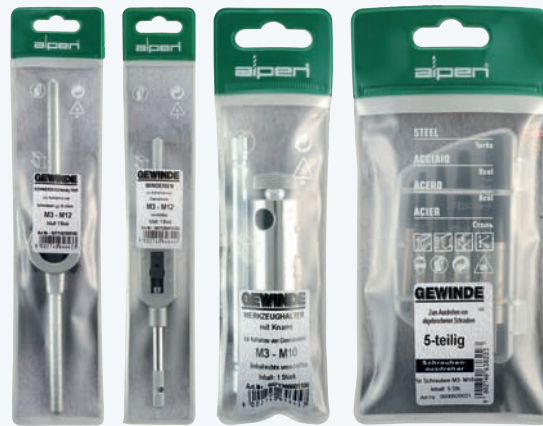
Plastiktasche | Plastic wallet Confezione busta